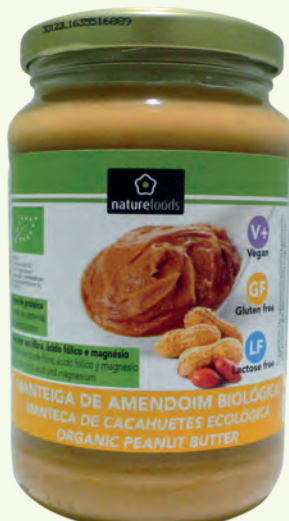
MANTEIGA DE AMENDOIM BIOLÓGICA DA NATUREFOODS 350 g