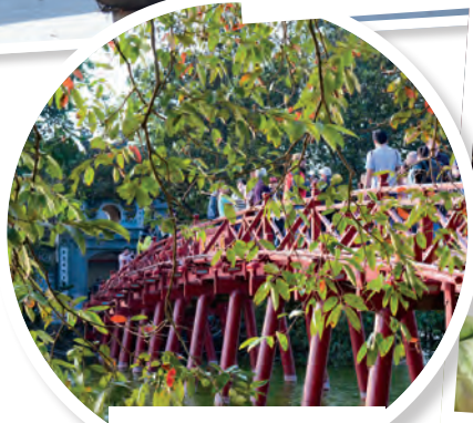
Ponte pedestre de Hoan Kiem Lake, Hanói