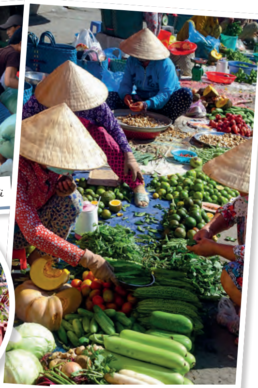
Mercado onde se vendem produtos locais

piscatória Vu Vieng, pela gruta Thien Canh Son com 250 metros de comprimento e 20 de profundidade e uns mergulhos na praia de Ban Chan. No barco há aulas de cozinha e pesca às lulas, mas imperdível é mesmo a aula de tai chi às 6h30 de manhã, altura em que o silêncio de HaLong Bay é ensurdecedor, uma experiência única, daquelas que arrepiam. Preço: a partir de 250€ em quarto duplo inclui refeições, transporte para o barco, refeições e atividades a bordo).