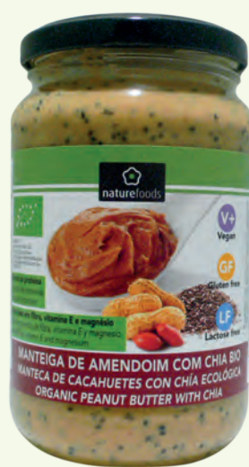
MANTEIGA DE AMENDOIM COM CHIA BIOLÓGICA DA NATUREFOODS 350 g