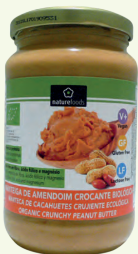
MANTEIGA DE AMENDOIM CROCANTE BIOLÓGICA DA NATUREFOODS 350 g

UM CREME BIOLÓGICO, SEM GLÚTEN NEM GORDURA DE PALMA, FONTE DE PROTEÍNA E COM ALTO TEOR DE FIBRA E MAGNÉSIO