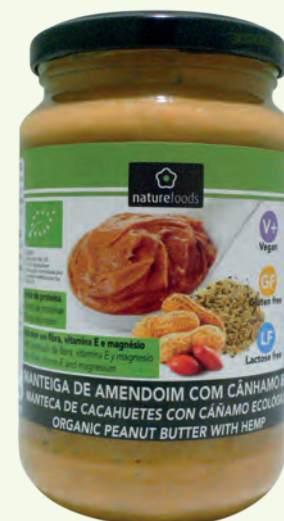
MANTEIGA DE AMENDOIM COM CÂNHAMO BIOLÓGICA DA NATUREFOODS 350 g