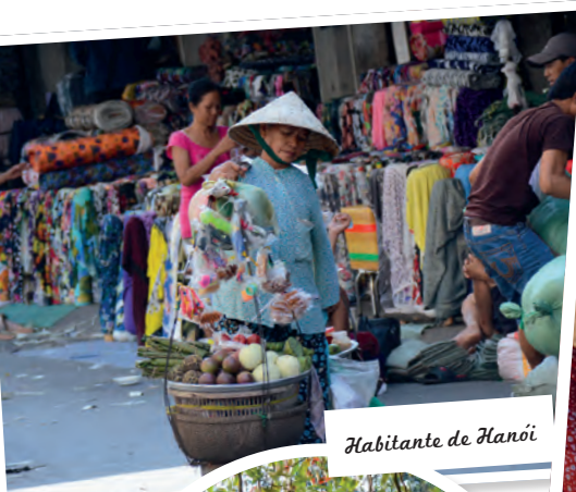
Habitante de Hanói