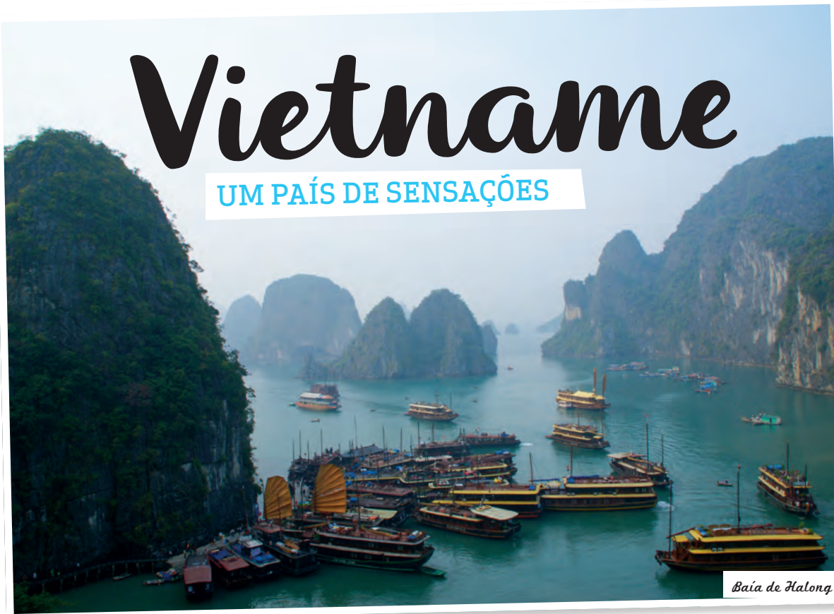
Baía de Halong

Exótico, surpreendente, fascinante e de uma beleza natural de tirar o fôlego, no Vietname o sossego dos templos e das praias contrasta com a agitação citadina de um povo resiliente e muito curioso.