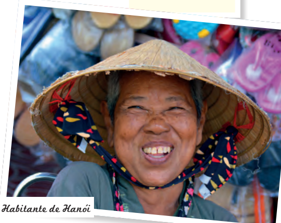
Habitante de Hanói

Hoi An é um sítio mágico que não pode deixar de conhecer